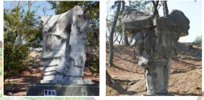
●壁訴訟 工藤健 ●石花 日高頼子 ●天の子 安田周三郎