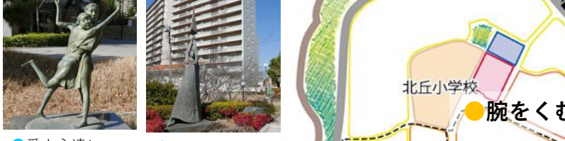
●愛よ永遠に 一色邦彦 ●にわか雨 工藤健