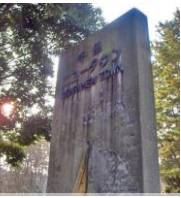
■ニュータウン 入口標柱