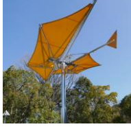
●森のささやき 新宮晋