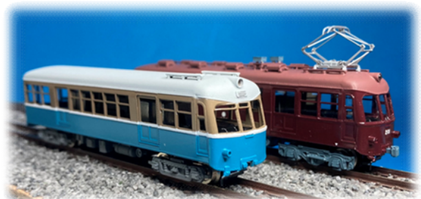
模型で楽しむ阪急千里線と市電

時間の経過とともに思い出もたくさんありますが、この時代の思い出は強烈に残っています。