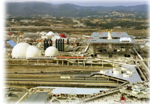
北大阪急行電鉄の万国博中央口駅発車式